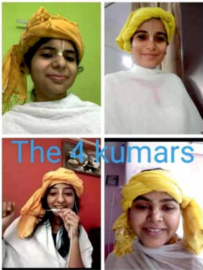
Bhadra Purnima (2nd September) (ISKCON – All Delhi-NCR Temples)

The Srimad Bhagavatam is the literary incarnation of the Lord. Replete with the pastimes and glories of the Lord it is the summum bonum of Vedic literature. Bhagavatam incarnates to give pleasure to the devotees, to provide them with content of their conversations and objects of their absorption. The Lord's pastimes are the easiest way to 'always remember Krishna and never forget Him', the basic tenet of spiritual life. The reading and hearing of the Bhagavatam is the most auspicious activity one can engage in.