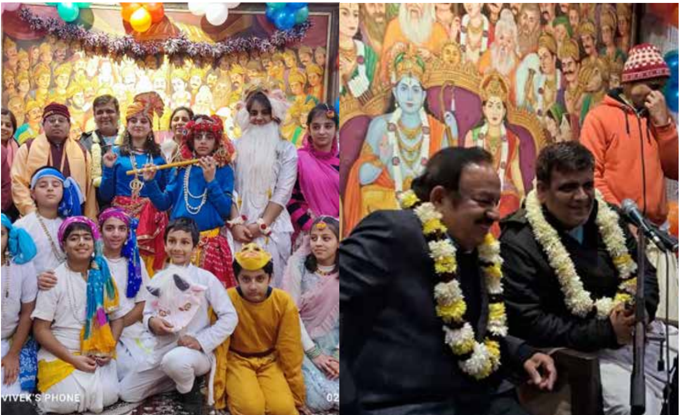
New year celebration 2024 in ISKCON Chhipiwara