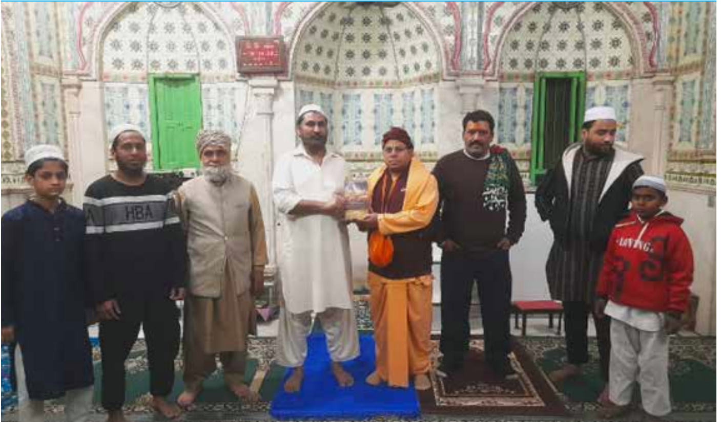
Bhagavad gita distribution in Masjid Churiwalan, Chawri bazar, Old Delhi